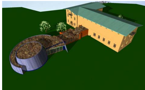
Abbildung 2: Schematische Ansicht des Besucherzentrums

Das Besucherzentrum wird eine Ausstellung sowie gastronomische Einrichtungen beherbergen. Abbildung 2 zeigt eine Ansicht des geplanten Erscheinungsbildes des zu sanierenden Haupthauses und des schneckenförmigen neuen Anbaus.